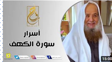
أسرار سورة الكهف