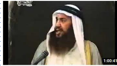
ويل للعرب من شر قد اقترب