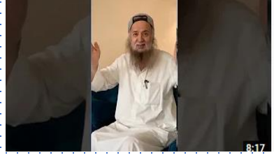
والله غالب على أمره