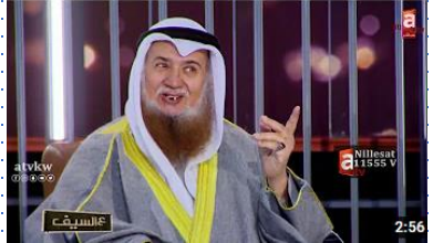
مو لقيط وتلميذ ابن باز