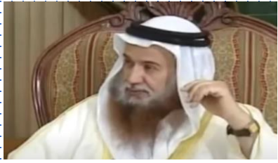
قصة بره بوالدته