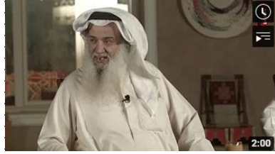
بالدين يسمو المرء للعلياء