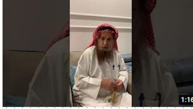
لا يضرهم من خذلهم