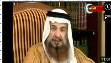
قصة توبة دكتور