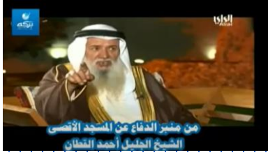
في القدس قد نطق الحجر