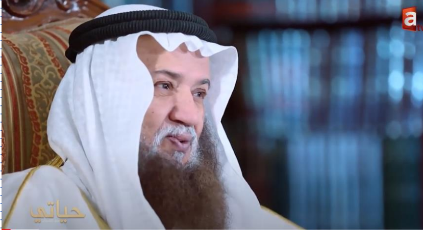
الشعر والإدب في حياة الشيخ احمد القطان