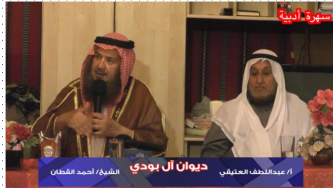
سهرة ادبية مع الشيخ / أحمد القطان