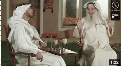
تزوجت اثنتين لحسن حظي