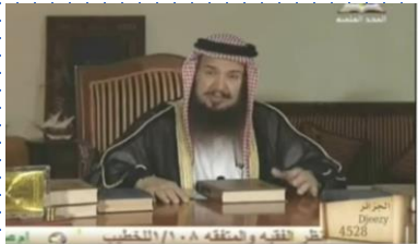
جليبيب رضي الله عنه