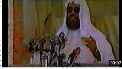
التحدي بين الإيمان والكفر