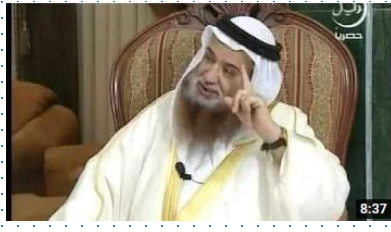
والد الشيخ وكرهته للدين