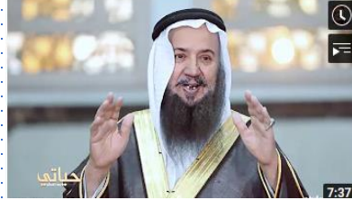
خطبة في العثمان غيرت حياتي