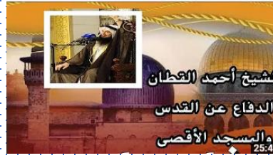
الدفاع عن القدس