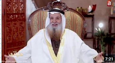
طفولة الشيخ أحمد القطان