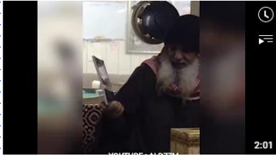
الراجحي في غزو الكويت