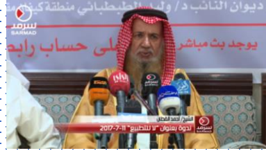
أخطر ما يكون التطبيع