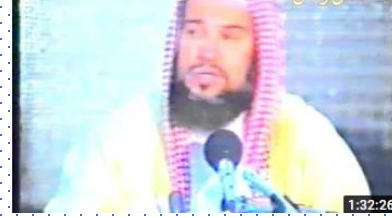
فاعتبروا يا أولي الأبواب