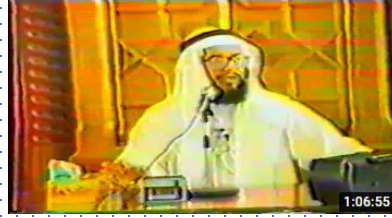
القرآن حماية وشفاء